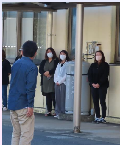
PTA会長と校長の挨拶